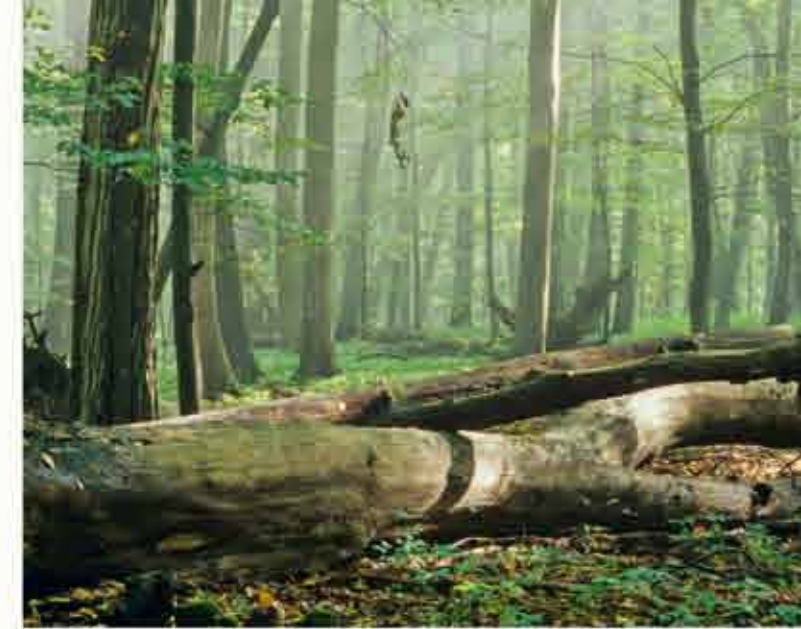
деревья – великаны в „Хайнихе“

Расположенный в самом центре Германии „Хайних“ - единственный из всех национальных парков имеет богатое культурное окружение. Города Бад Лангензальца,