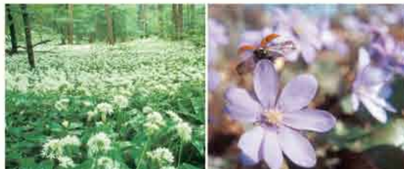
ВЕЛИКОЛЕПИЕ ЦВЕТОВ В „ХАЙНИХЕ“

“Хайних” является самым большим сплошным районом лиственных лесов Германии и имеет площадь 13.000 гектаров. Национальный парк величиной в 7.500 гектаров находится в южной части леса „Хайних“.