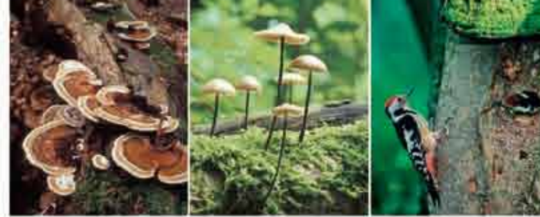
ЖИЗНЬ НА МЁРТВЫХ ДЕРЕВЬЯХ